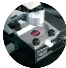
ナノ粒子解析システム NanoSight NS300

※「ファインバブル」、「ウルトラファインバブル」は、一般社団法人ファインバブル産業会の登録商標です。